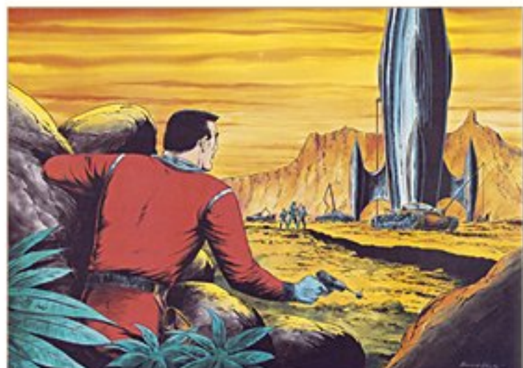
Nick Luxus Nr. 1 – INCOS Sonderausgabe – Sputnik explodiert