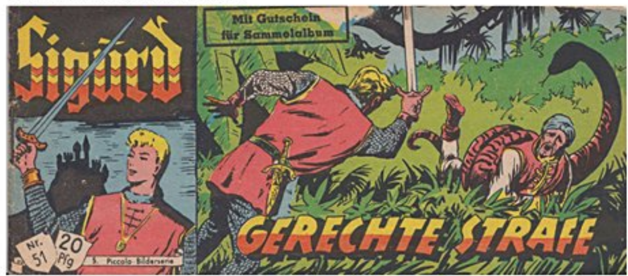
Sigurd Piccolo Nr. 51 vom September 1954.