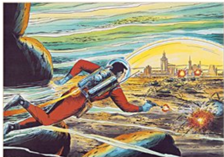
Nick Luxus Nr. 1 – Sputnik explodiert